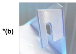
Soportes de Fijación del equipo

2) Monte el equipo en los tornillos de fijación ya previamente montados ocupando como apoyo, sólo los soportes de fijación del equipo de luz *(b), o cuelgue el equipo ocupando los orificios laterales.