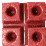
Mini Bloque Parafinado