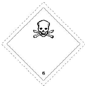
Rótulo Peligro Principal